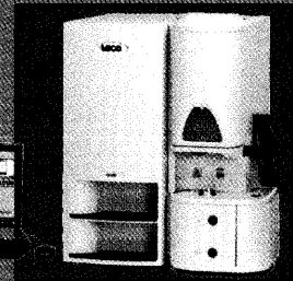
CS600型 炭素/硫黄分析装置