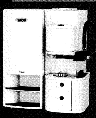
TCH600型 窒素/酸素/水素分析装置