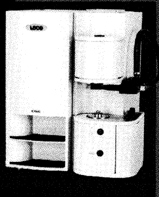
TCH600型 窒素/酸素/水素分析計