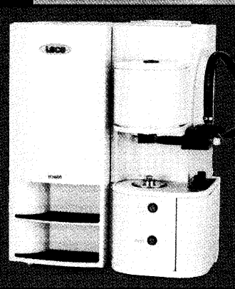
TCH600型 窒素/酸素/水素分析装置