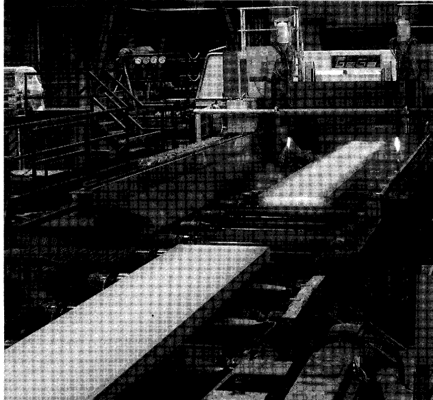
最新型 GBMスラブ切断装置

連続铸造用ガス切断装置として、ブルーム/ピレット用で1010基、スラブ用で420基、幅分割用で240基、その他特殊装置で約180基などなどの納入実績を有するドイツのゲガ・ロット社は、常に最新の技術を以て、世界の製鉄製鋼業界のご要望に貢献してきております。さらに機械式バリ除去装置も、1990年1号機を開発納入以来、すでに39基の納入実績を持つに至っております。鑄片端部に付着しているノロを多数の刃型ナイフで除去するこの装置は、粉塵や騒音がほとんど発生しないため、良好な作業環境の維持に寄与しております。