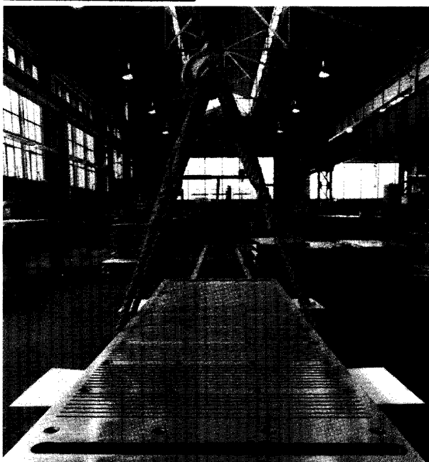
スラブ用モールドプレート

KMヨーロッパメタル社は、最適な素材で以て、各種モールド製品を提供しております。