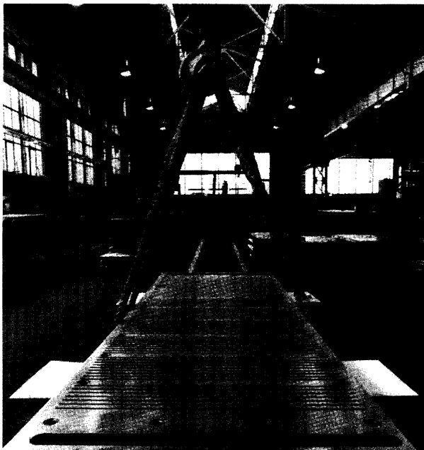
スラブ用モールドプレート

KMヨーロッパメタル社は、最適な素材で以て、各種モールド製品を提供しております。