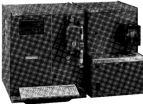
測定部寸法(mm) 710(H)×610(W)×690(D) 炉寸法(mm) 760(H)×460(W)×690(D)

永年の実績と信頼を誇るTC-136シリーズが、一段と使いやすくグレードアップしてTC-300シリーズとしてよみがえりました。酸素・窒素分析装置の更新にはTC-300シリーズを是非ご検討下さい。