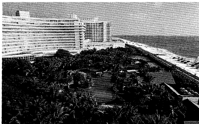
フォンテンブリューヒルトンホテルの全景。16kmのビーチが長く延びる。

本大会のシンポジウムは以下の分野に大別される。電池、腐食、めっき、物理化学、半導体、誘電体、センサー、ル