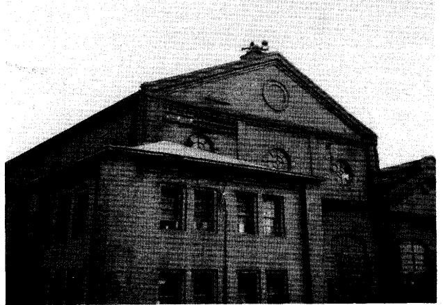
写真3 赤レンガ製工場