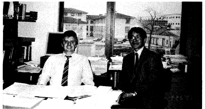
CMUのAlan Cramb教授のオフィスで (左から、Cramb教授、筆者)

だ、実験的手法を駆使した研究は乏しく、計算機支援のプロセス解析やシミュレーションが最近のトレンドとなっているようです。