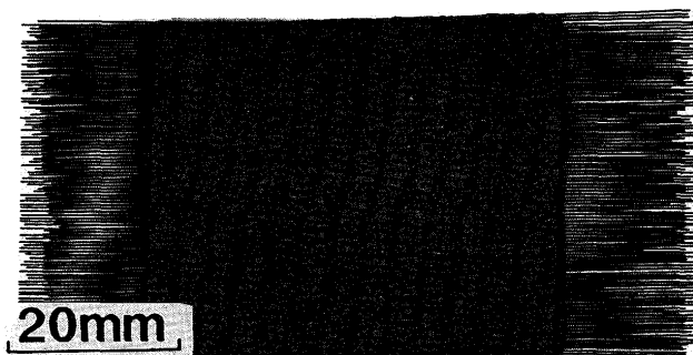
図3 耐熱性と高強度を具備するC-Si繊維強化Ti-TiN基複合材料