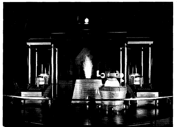
第2展示室ハイテク”たたら”

第1展示室を出て、やや暗い洞窟を思わせる階段を登って行くと、押立柱のある”高殿”を模した第2展示室に入る。ここは”炎と鉄の科学”をテーマとしたハイテクディスプレイを主とした展示室で、クラシックな部屋の雰囲気とモダンなディスプレイが印象的である。