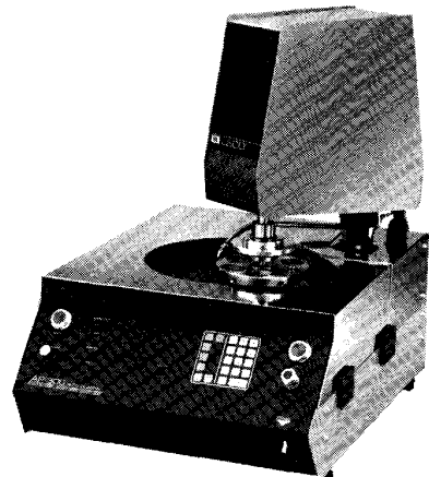
AP-300 オートポリッシャー (ベンチ・タイプ)

金相試料調整装置および金属中 ガス分析装置の専門メーカー、 米国LECO社の製品は、金属 セラミックス等材料関係、機械、 電機、自動車、航空機産業およ び各種研究機関等に幅広く普及 しております。米国ミシガン州 の本社工場、米国国内およびヨ ーロッパの分工場で生産された 製品は、本体から各種消耗部品 まですべて、世界中の販売サー ビス網を通じて迅速にサプライ されており、我が国でもお客様の 信頼とご愛顧をいただいております。