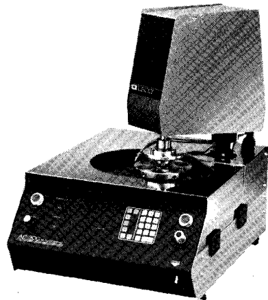
AP-300 オートポリッシャー (ベンチ・タイプ)

金相試料調整装置および金属中 ガス分析装置の専門メーカー、 米 国 L E C O 社 の 製 品 は 、 金 属 セラミックス等材料関係、機械、 電機、自動車、航空機産業およ び各種研究機関等に幅広く普及 しております。米 国 ミシガン州 の本社工場、米 国 国 内 お よ び ヨ ーロッパの分工場で生産された 製品は、本体から各種消耗部品 まですべて、世界中の販売サー ビス網を通じて迅速にサプライ されており、我が国でもお客様の 信頼とご愛顧をいただいております。