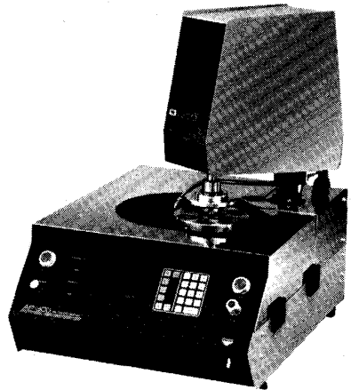
AP-300 オートポリッシャー (ベンチ・タイプ)

金相試料調整装置および金属中ガス分析装置の専門メーカー、米国LECO社の製品は、金属セラミックス等材料関係、機械、電機、自動車、航空機産業および各種研究機関等に幅広く普及しております。米国ミシガン州の本社工場、米国国内およびヨーロッパの分工場生産された製品は、本体から各種消耗部品まですべて、世界中の販売サービス網を通じて迅速にサプライされており、我が国でもお客様の信頼とご愛顧をいただいております。