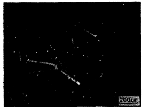
Photo. 1 Fine carbides in C-12 steel irradiated to 1 \times 10^{20} \text{ n/cm}^2 .