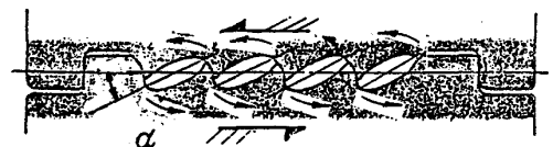
Fig. 3 Slitting roll profile