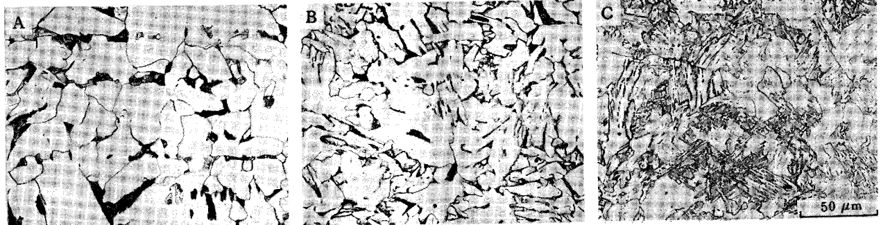
Photo. 1 Typical microstructures of steels (A: 4.0 °C/s, B: 8.4 °C/s, C: 24 °C/s)