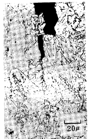
Photo. 1 The separation occurred in Charpy in impact test specimen of 0.3% Mn steel.