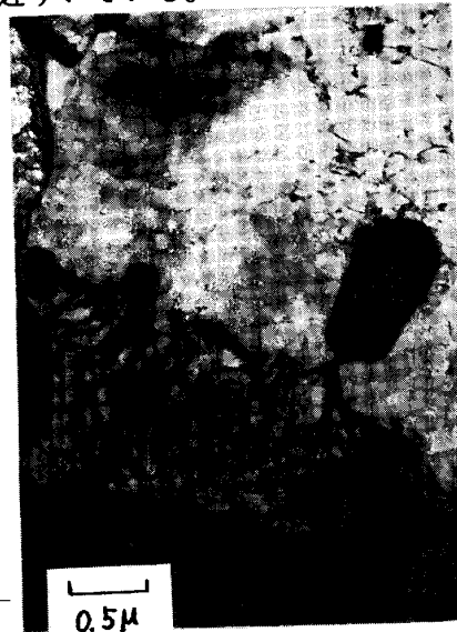
Photo. 1 Microstructure of SWR72B steel quenched at 715°C during slow cooling from 745°C.