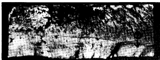
Photo 1. Macro fracture of field pipe

パイプに外表面側から塑性変形を与えたあとのくり返し荷重を想定すると残留応力が重畳して部分片張りとなると考え実管による室内実験を行った。その結果水洩れ部と同様な破壊現象が確認された(Fig 1, Photo 2)。