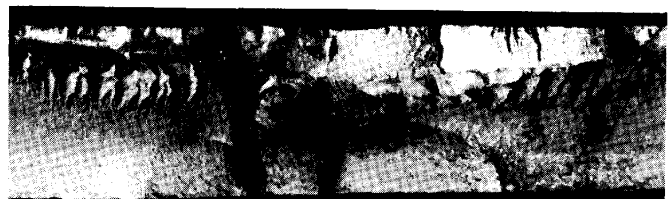
Photo 2. Macro fracture of test pipe