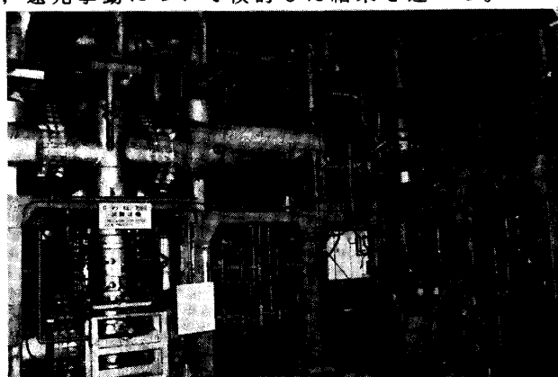
Photo.1 Simulator for rotary kiln process.