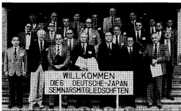
写真 2 山陽特殊製鋼(株)訪問のドイツ代表団