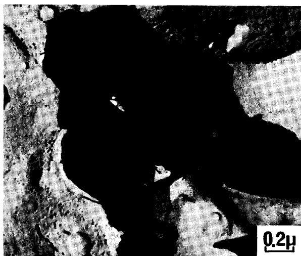
Photo. 1 Morphology of fine precipitates formed on the surface of silicon steel during slab soaking after rinsing in aqueous solution of CaMoO 4 .