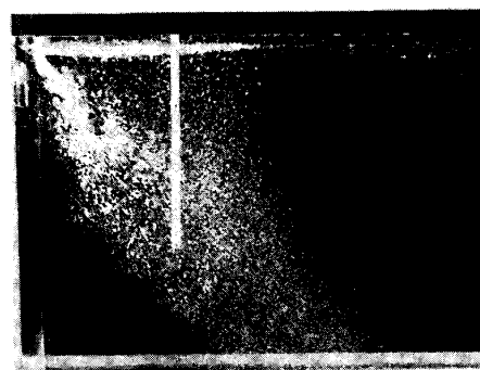
Photo.1 Powder penetration with falling water (falling distance=2.3cm)