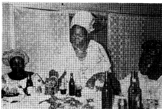
写真3 X'mas パーティのひとこま。ビールは日本と同じサイズ。味は国際水準を行く。右端は労務課長。

南北か)を問わず、まつすぐな髪はちぢらせたい、ちぢれたやつのはぼしたい、いやお忙しいことである。男女を問わず皮膚の黒と主張の強い原色とがよくマッチして我々ならチンドン屋になる所をさらりと着こなしているのは見事の一語につきる。