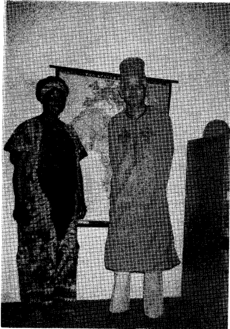
写真1 帰国直前。現地職員から贈られた民族衣裳を着て、秘書と。わかりやすい英語を喋ってくれる文字通り有能な祐筆だった。

筆者は 1978 年から 3 年 1 か月間、ナイジェリア共和国で亜鉛鉄板製造合弁企業（日、英、60%、現地 40%）の経営に当たった。アフリカ生活を終わって帰国した直後は、見るもの聞くものすべて大平の夢をむさぼっている情眼中の日本と映り、逆カルチャーショックを受けた。