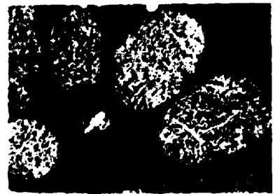
Photo.1 Generated metal in the undissolved chromite