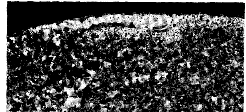
Photo1. Scab due to Steel Making

Type C : 線材圧延に起因した疵は疵内スケールの大部分が2層（線材表面の二次スケールと同じ）であり、Fayalite が少ない。また介在物の痕跡や粒状酸化物が認められない。