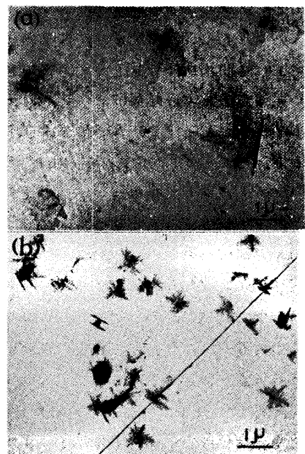
Photo. 1 Comparison of carbide morphology extracted in (a) conventional and (b) new etchant

Photo.1に示したように(a)は従来電解腐食液を用いた場合で炭化物が分解しその痕跡のみ認められる。(b)は本液を用いた場合で析出物が完全に抽出されている。