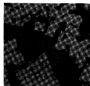
Photo.1 Microstructure of Sinter