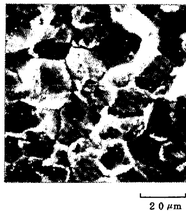
写真1 遅れ破壊破面の例(0.015S)