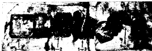
Photo.1 Deteriorated carbon block obtained from side wall below tuyere of blast furnace

高炉炉底カーボンブロック脆化層の解明に分析的手法から検討を行った結果, 羽口下部から出銑口にかけて, おもに Znと共にKの侵入が粉化を助長させているのではないかとと思われる。