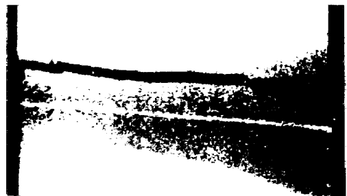
写真 1. 疲労き裂の伝播経路の例