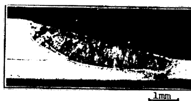
Photo.2. The cross section of TIG lap joint weld zone.