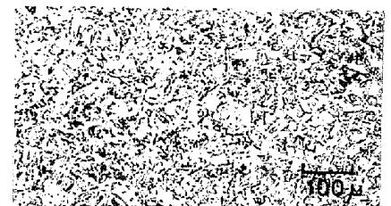
(A) N 0.008%