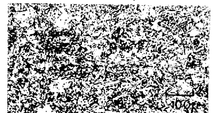
(B) N 0.002%