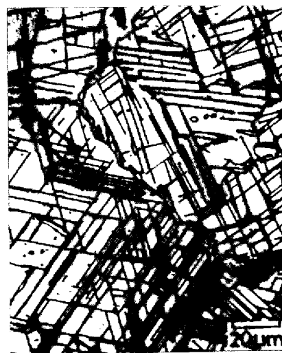
写真1. 1000℃、応力30kgf/mm 2 でクリープ破断した8wt%Nb添加合金の顕微鏡観察組織 (t r = 41h, ×600)