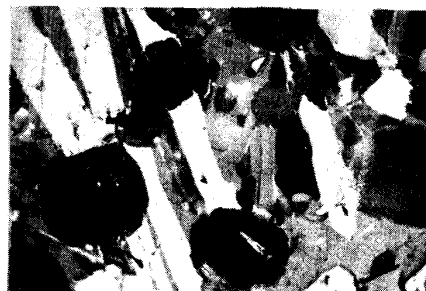
写真1 転炉スラグ中の粒状のライム(丸い黒色の鉱物)

X線およびEPMAによる分析の結果、転炉スラグの鉱物はカルシウムシリケート、カルシウムフェライト、ブスタイト、Fe、Mn、Mgを含有するライムが主な鉱物相であることが明らかとなった。ライム相の形態としては、径数10ミクロンの粒状のライム(写真1)、カルシウムフェライト中の線状のライム、未滓化状態の塊状のライムが認められた。粒状のライム、線状のライムは相内に固溶成分の濃度偏析がないことおよび形態から判断して析出ライムと推定された。