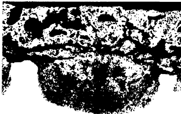
写真3 高酸素側の内部酸化が不規則に発達した例