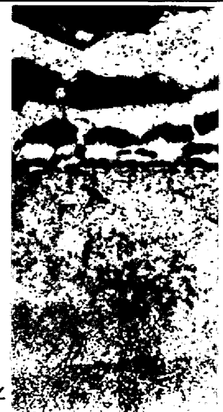
写真4 低酸素側の内部酸化特有な外層の発達したスケール