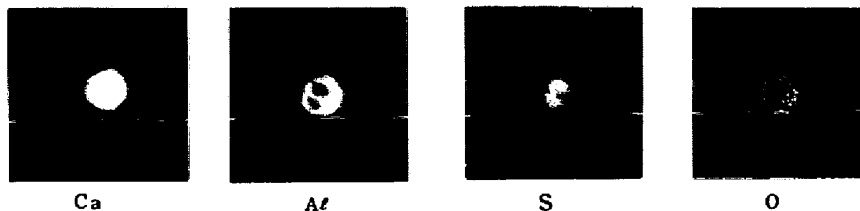
写真-2 250トン取鍋の溶鋼中の介在物EPMA同定結果