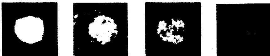
写真-1 高周波溶解炉の溶鋼中の介在物EPMA同定結果

2. 福山250トン取鍋にCaを添加した直後に溶鋼から採取した試料には、Ca添加量が少い場合にはCaSを均一に含んだCaO-Al 2 O 3 系介在物が認められ、添加量が多くなると写真-2に示すように、CaSを異相として含む介在物も観察された。