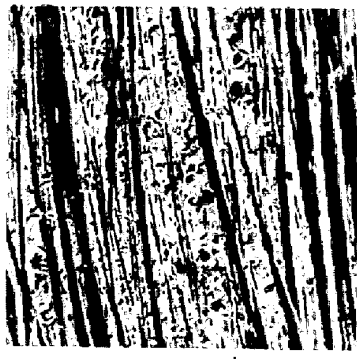
写真1 継手部の引張破面 S45C 600~850~600°C 2分/サイクル×8サイクル 100kg(1.3kg/cm 2 )

このこと確認するため、一方の接合面に高さ約1.7mm、底辺2mmの三角形の断面をもつ同心円状の突起を人為的に加工し、平滑接合面と接合させた。引張破面のSEM写真を写真2に示すが、「加熱バタンの違いによる「突起の変形」の差異が接合の様相を変化させていることが明瞭である。したがって、固相接合=接合面の「突起の変形」であり、「突起の変形」の様相の違いで接合法の特徴を説明出来る。