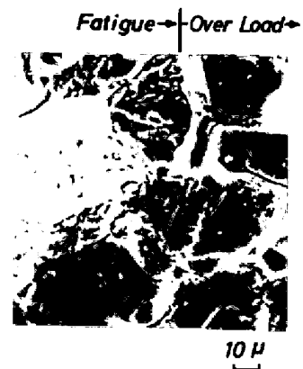
図3 焼もどし脆化材の破壊靱性試験片破面の一例

0.3 C-1 Mn-1 Cr-0.03 P-3 Ni 鋼。試験温度：-180°C