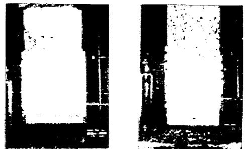
(1) 液の流入流出無 (2) 液の流入流出反復後