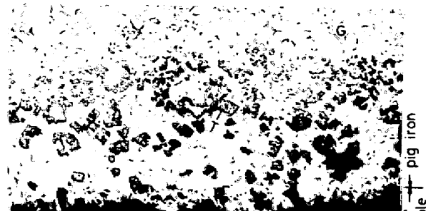
写真 2. サンプル底部のマイクロ組織