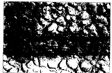
写真3. 377°Cにおけるぶりき合金層の二次生長(5000倍)