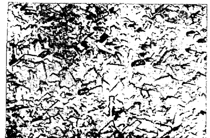
写真2. 277°Cにおけるぶりき合金層の二次生長(5000倍)