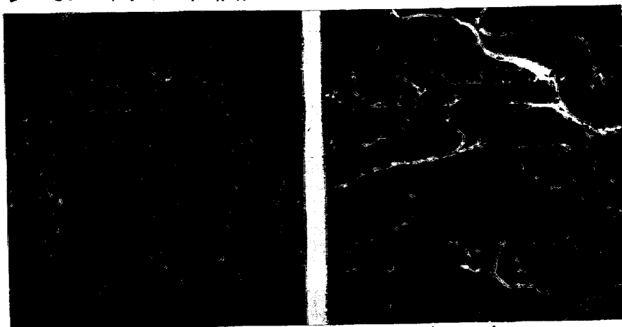
写真1 伸延状介在物に沿うセパレーション面(x230)

(3) 上記脆化層の中、最も重要なものは劈開破壊によるものである。この脆化層の成因は低温領域での圧延により形成される集合組織と密接な関係があり、板面に平行に{100}集合組織が形成されている。(図1) この集合組織の形成のため{100}面に生ずる劈開亀裂が生成し易くなるものと考えられ、セパレーションにみられる劈開破面の破面単位は破断破面上のそれと比し大きくなっている。