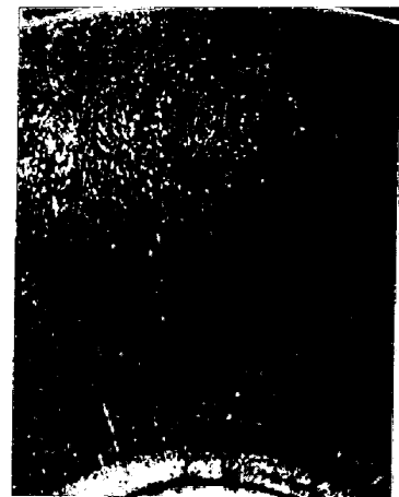
写真1 131rPm回転凝固における炭素鋼のテンドライトの発達形態(×1.8)

1 流動速度と凝固速度と偏向角度との関係：図1に偏向角度 30°, 25°, 10°, 5° について流動速度と凝固速度との関係を示した。各回転凝固試料に見られることは、テンドライトは概ね真直ぐのびていると共にその成長が終って次のテンドライト集団に遷移するとき結晶成長方向に変位が生ずる。流動速度の増加と共に偏向角度は増加しているが、凝固速度の速い初期段階よりも凝固速度の遅くなる領域において流動速度の影響を強く受けている。また平均流動速度の速い試料になるほど柱状晶領域はしだいに減少して、反面自由晶域が増加することが認められる。