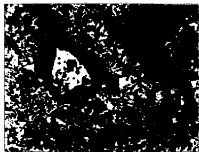
写真1. アルミナ粒の溶解過程(中央部) 1500°C X 5mm 0.5mm