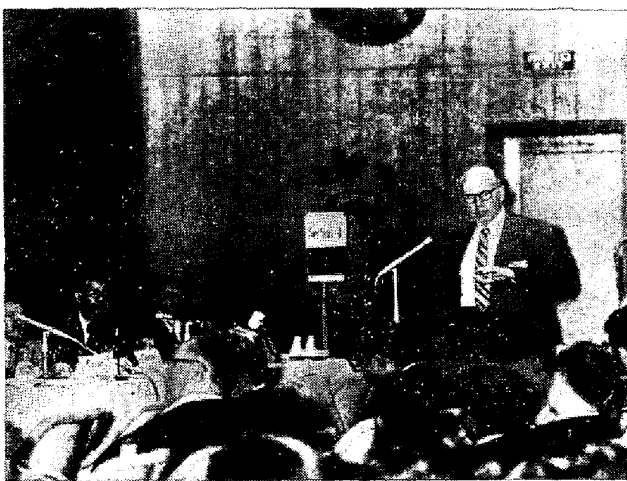
ダイカッション風景

の section は真空冶金の基礎というより、むしろ section 2 で取扱う鉄鋼関係の物理化学という色彩が強かった。