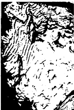
写真1 分塊ロール折損面の Striation