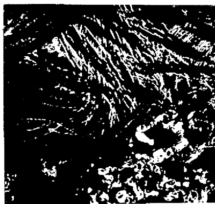
図.3 1300° 15分-炉冷 (x400) (石灰無添加)