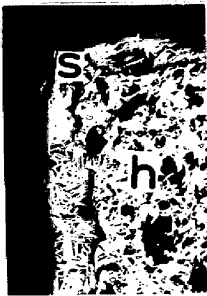
図.2 1250° 15分-空冷 (x80) S:スラグ h:酸化鉄